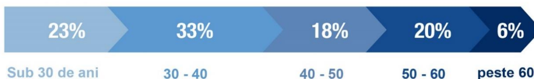
Distribuția pe vârste a angajaților Băncii Naționale a Moldovei

Banca promovează echilibrul între muncă și viața personală, prin încurajarea participării în proiecte de dezvoltare personală. Banca Națională a Moldovei încurajează angajații să dezvolte o viață activă, sănătoasă și dinamică. În acest sens, BNM oferă angajaților săi posibilitatea de a accesa la prețuri negociate unele activități sportive. Totodată, BNM organizează pentru angajații săi excursii către diverse atracții turistice din țară, printre care monumente culturale și arhitecturale, muzee și mănăstiri. În același timp, BNM asigură un flux operațional omogen prin crearea unui mediu de lucru prietenos, bazat pe eliminarea conflictului și a discriminării, și pe promovarea transparenței.